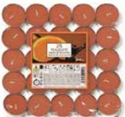
Orange & Schokolade

Scented tealights pack of 25- Orange & Chocolate