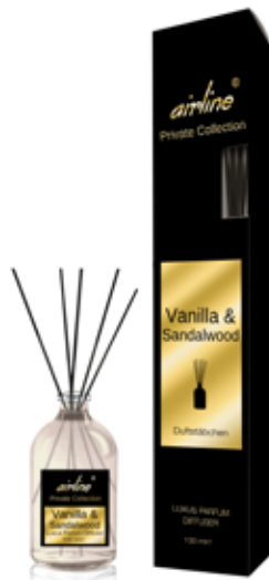
Vanilla & Sandalwood