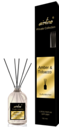
Amber & Tobacco